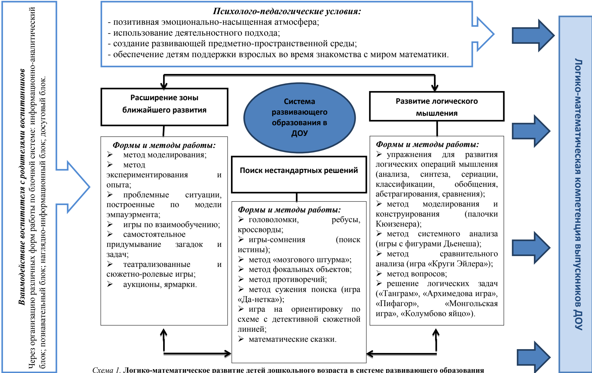
Схема 1. Логико-математическое развитие детей дошкольного возраста в системе развивающего образования